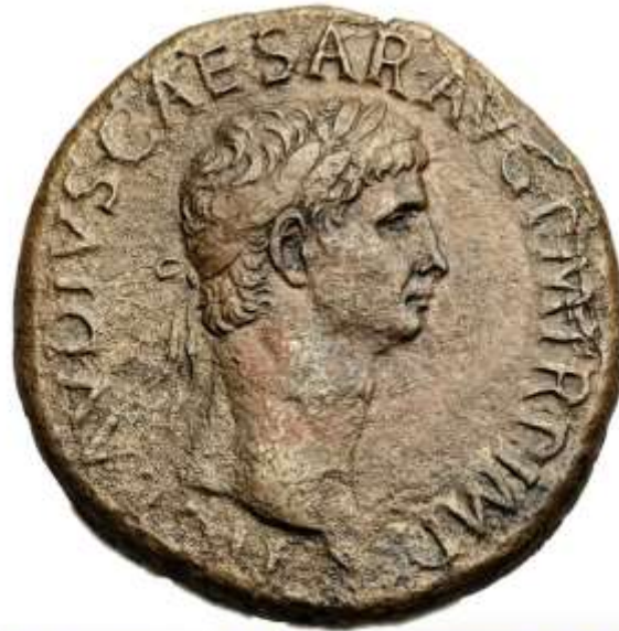
Sestertius - CLAUDIUS IMPERATOR